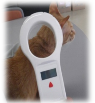
皮下に埋め込み リーダーで読み取る